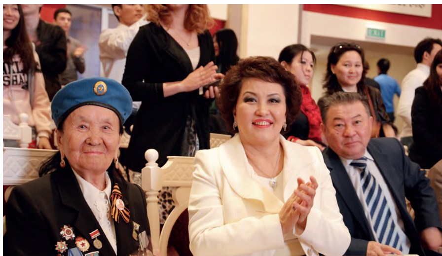
Қазақ ұлттық өнер университетінде. Астана. Период работы в КазНУИ. Астана