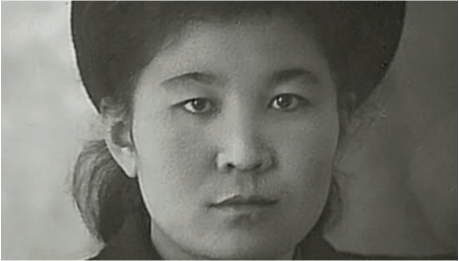
Жастық шақ. Молодые годы