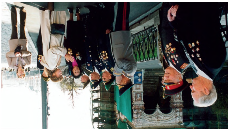
Естелікке тобы өмір. Жизнь – покая воспоминаний