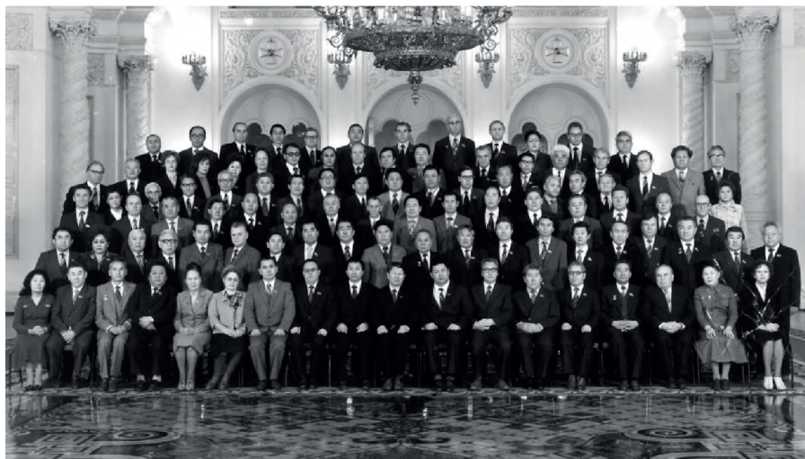
Қазақ мемлекеттік университетінде қызмет атқарған кезең. Алматы. Период работы в КазГУ. Алматы